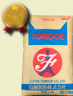
【鐵塔法印 法國粉】 日本最古老第一支法國粉